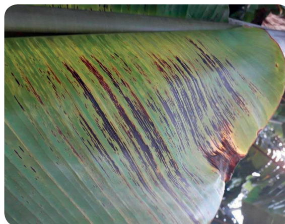
Noircissement et nécroses des tirets