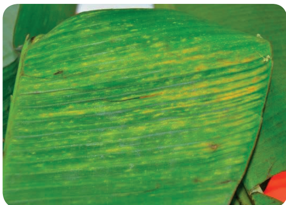
Évolution des tirets en taches jaune sur feuilles