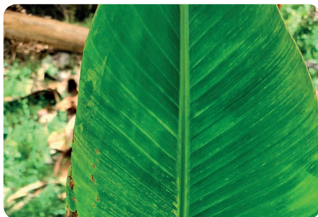
Mosaïque en tiret sur jeune feuille

Au niveau interne, les tissus vasculaires de la tige infectés se brunissent puis se nécrosent.