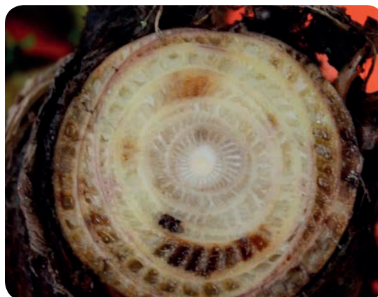
Brunissement et nécrose des tissus vasculaires