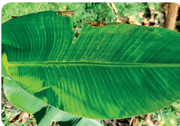
Tirets chlorotiques sur jeune feuille